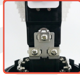
Permite el ingreso de 3 cables por el puerto oval.