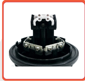
Soportes Miembro tensil.